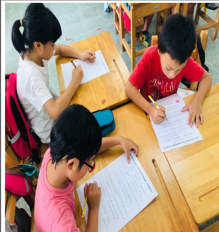
說明：交通安全常識測驗。