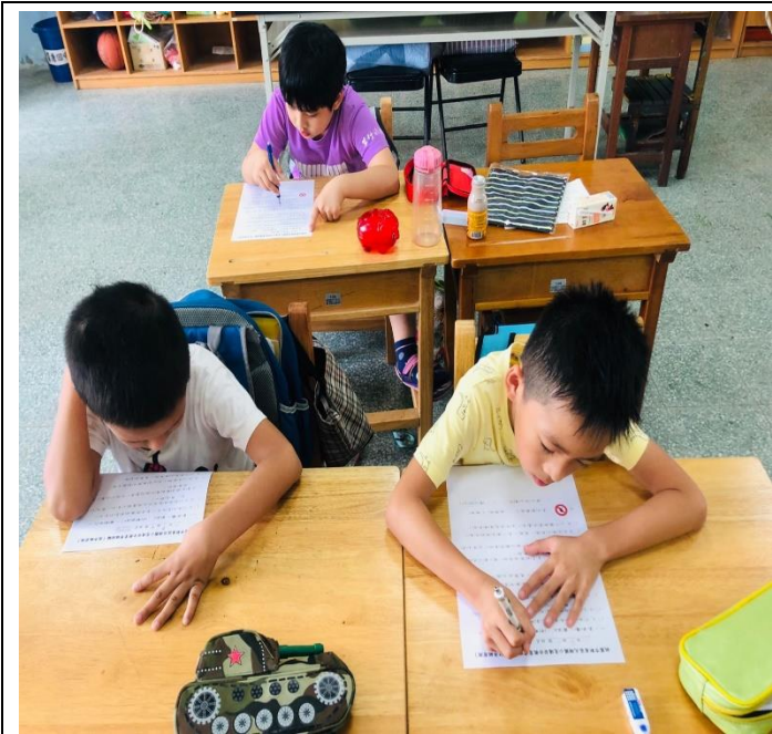
說明：交通安全常識測驗。