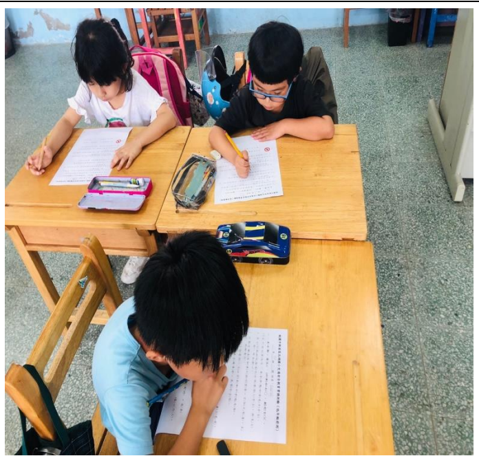
說明：交通安全常識測驗。